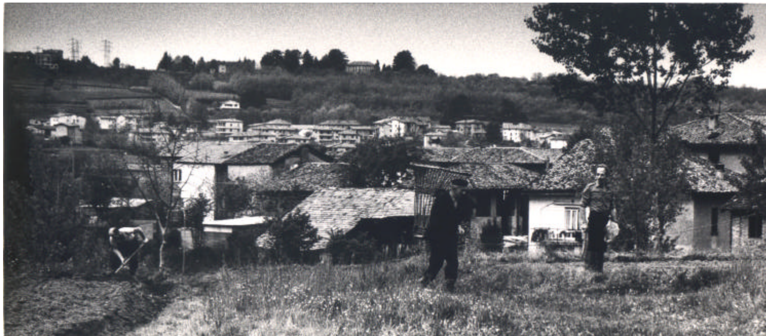
Sirone vista da San Benedetto