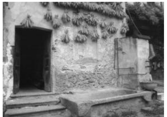
Masso avello usato come lavatoio nella corte dei Tavecchi