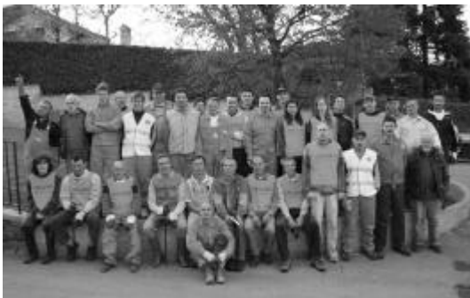
Il gruppo di protezione civile di Sirone

parte dei proprietari dei terreni fronteggianti gli stessi, mediante l'asportazione di parti vegetali (arbusti e siepi in generale) creatisi lungo gli alvei, e alla rimozione di pietrame che normalmente si deposita lungo il fondo dell'alveo ostacolando il regolare deflusso delle acque.