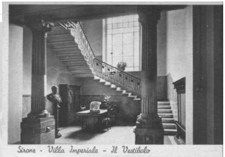
Sirone - Villa Imperiale - Il Vestibolo

Le frazioni estranee maggiormente presenti sono risultate: carta sporca, tetrapak, piatti in plastica, sacchi indifferenziati, organico, sigarette, cartacce e pannolini, tutti materiali che non devono essere inseriti nel sacco viola . Con un po' di impegno e maggior attenzione, sarà sicuramente possibile migliorare la qualità della raccolta.